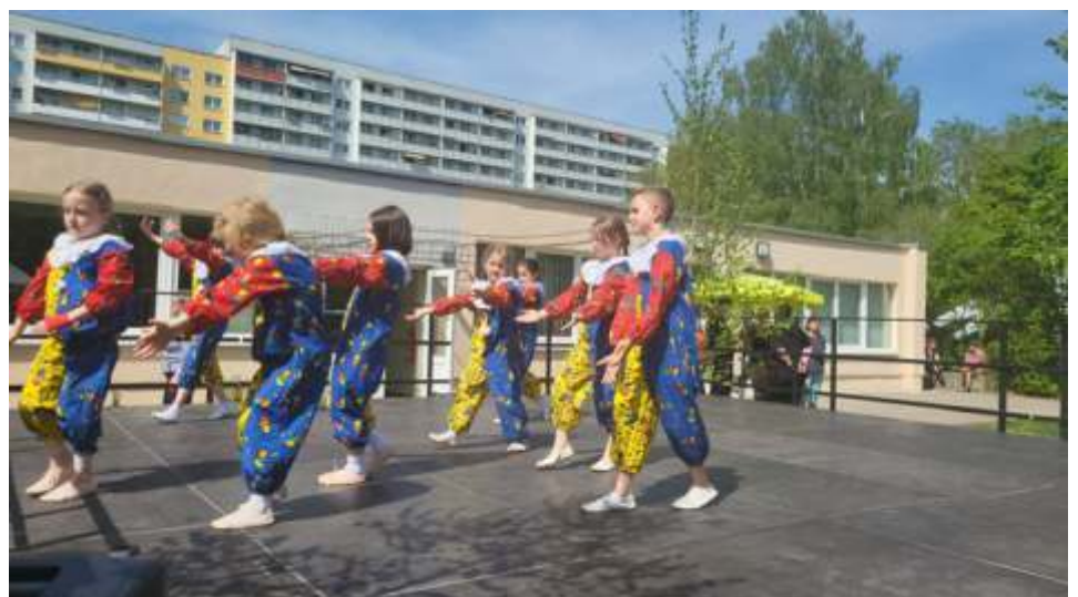
Die Flotten Käfer mit Harlekin