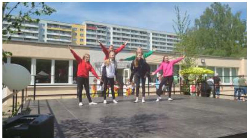
Die Future Girls mit Throwback

Die kleinen Flotten Käfer gingen mal wieder völlig ungezwungen und ohne Angst auf die Bühne und überzeugten mit Turntiger, Harlekin und dem Heißen Sommer. Rund um ein gelungenes Programm.